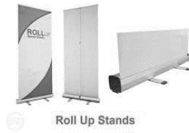
Roll Up Stands